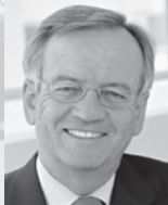
Dr. Heinrich von Pierer , Vorsitzender des Aufsichtsrats, Siemens AG; Vorsitzender, Asien-Pazifik-Ausschuss der Deutschen Wirtschaft